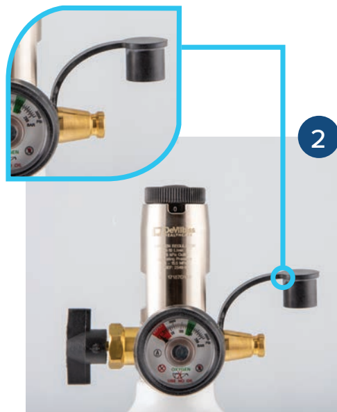
2 Retirer la protection du coupleur.