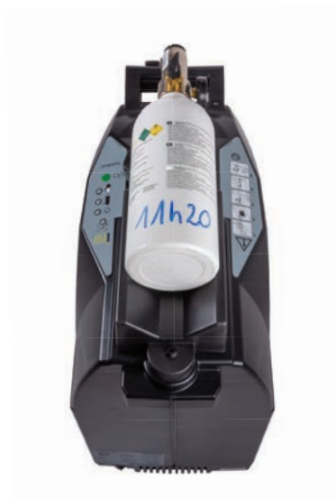
3 Noter l'heure de début de remplissage au feutre effaçable.