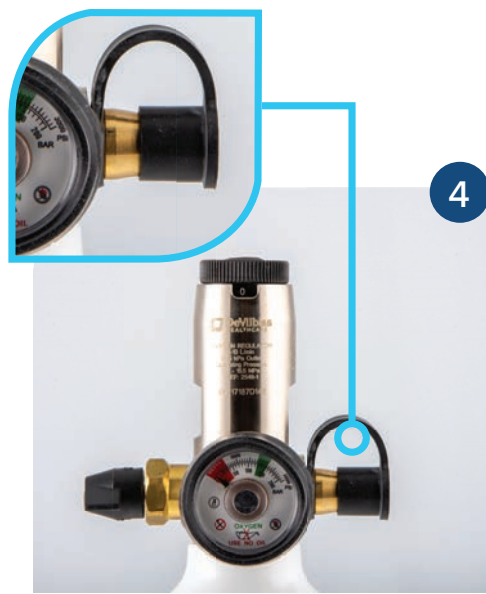
4 Refermer la protection du coupleur.

Nb : la fuite d'O 2 lors de la fermeture de la vanne d'arrêt est normale et peut durer jusqu'à 1 minute. Elle correspond à la quantité d'O 2 contenue entre la vanne d'arrêt et la sortie patient. NE PAS FORCER sur la vanne d'arrêt.